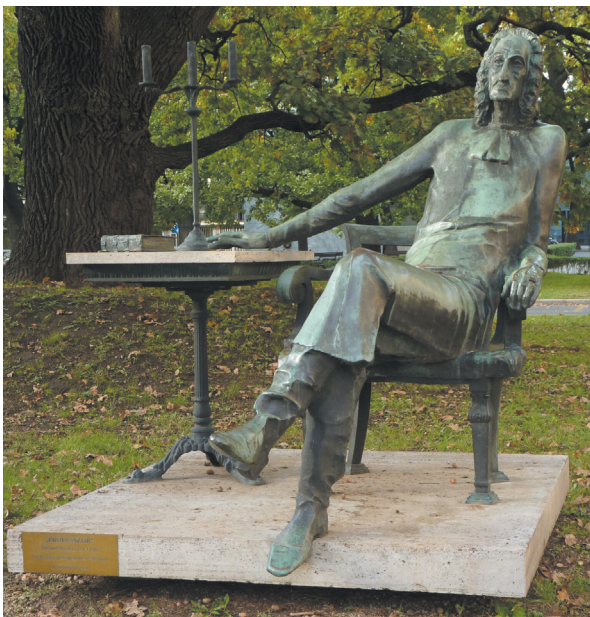
12. kép - A szobor neve: A professzor. Hatvani Istvánról, egyik legnagyobb polihisztorunkról mintázta Varga Imre.