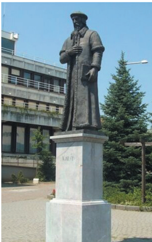
2. kép - Kálvin János egészalakos szobra Mátészalkán. Készült 1999-ben, Bíró Lajos alkotása.