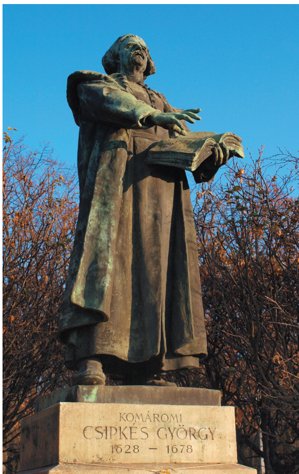
10. kép - Komáromi Csipkés György reformátor szobra a Debreceni Egyetem előtti parkban. Kisfaludy Strobl Zsigmond alkotása.