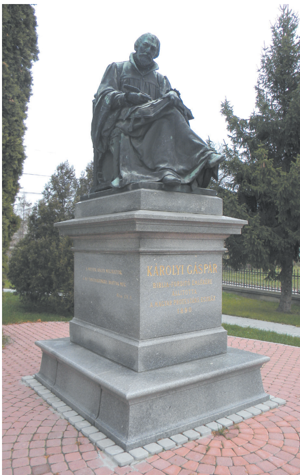
11. kép - Károlyi Gáspár szobra a Gönci Református Templom parkjában. Ő és tudós lelkésztársai fordították le és a közeli Vizsolyban nyomtatták ki a teljes Bibliát magyar nyelven 1590-ben.