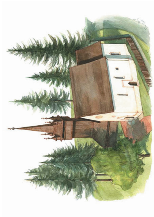
16. kép - Vámosatyvai református templom. A 13. században épült korai gót stílusban, 1565-től a reformátussá lett falu istentiszteleti helye. Képeslap.