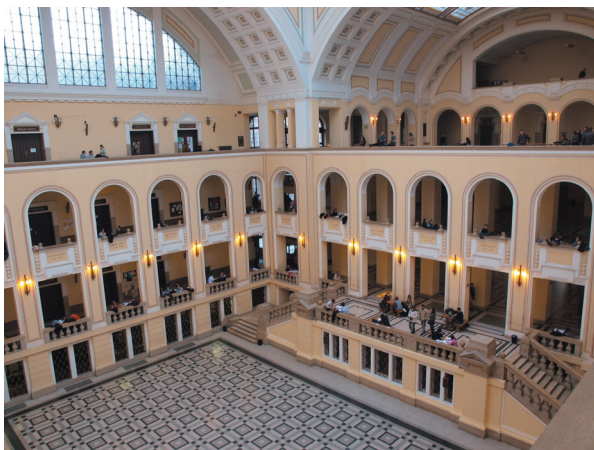
6. kép - A Debreceni Egyetem és díszudvara híres tanárainak és diákjainak nevével. Valamennyien a Református Kollégiumhoz kötődnek.