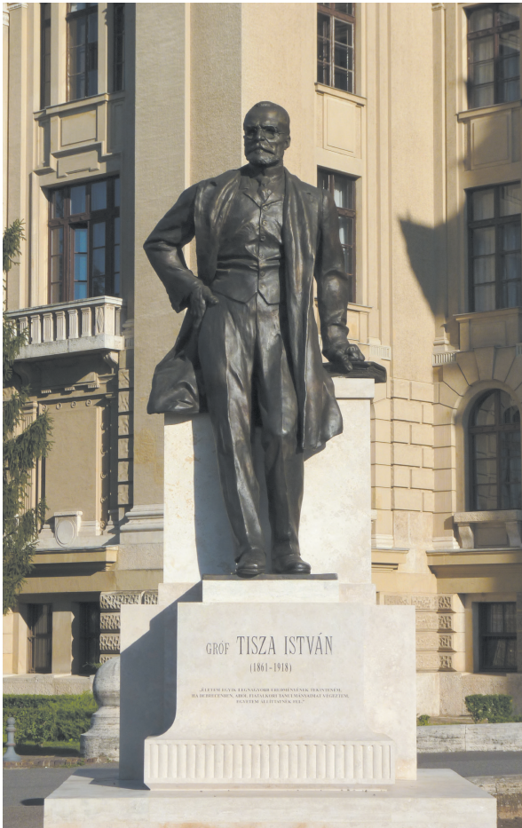
15. kép - Tisza István Magyarország miniszterelnöke, református főgondnok, akinek tekintélye és akarata révén hozta létre a Magyar Országgyűlés a Debreceni Egyetemet 1912-ben. Kisfaludy Strobl Zsigmond alkotása.